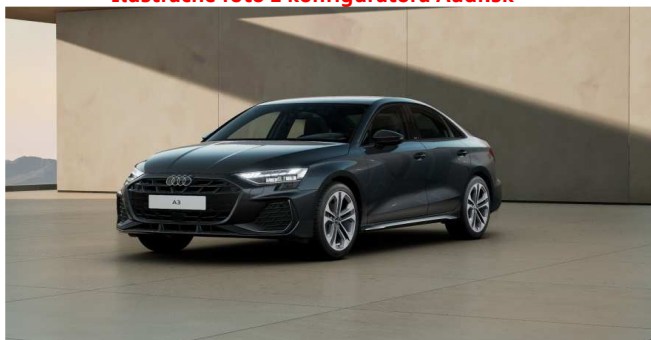
Ilustračné foto z konfigurátora Audi.sk